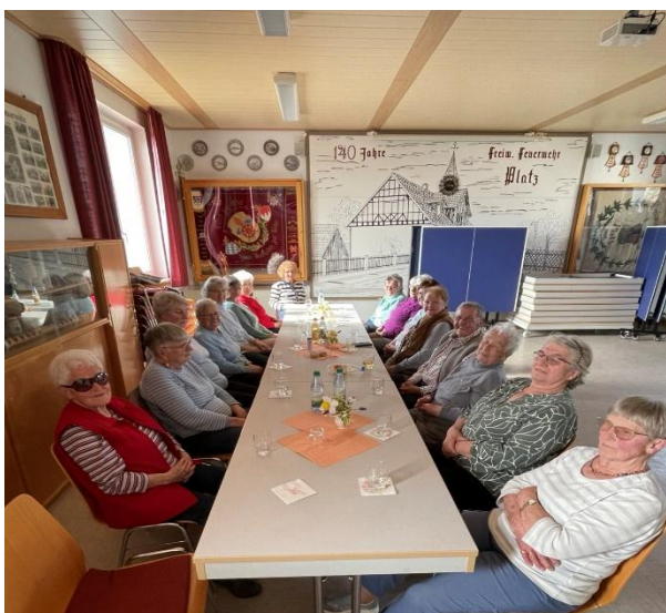
Der Seniorennachmittag in Platz am 14.04.2026 zum Thema „Ich trage einen Namen“ war gut besucht. Es war eine herzliche und fröhliche Runde.